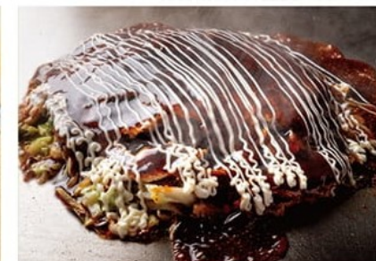
選べるお好み焼き(具材は豚・イカ・エビからお選びいただけます。)