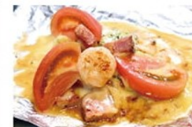
トマトチーズ焼き