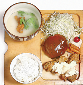
炭焼 鶏ハンバーグ と チキン南蛮 ¥1200