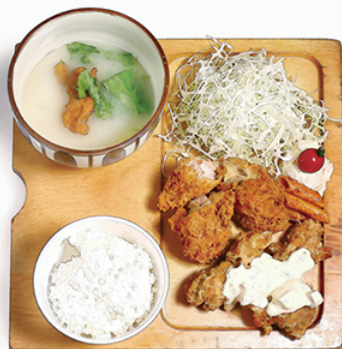
チキンカツ と チキン南蛮 ¥1150