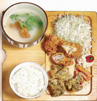
チキンカツ と スパイスとりから ¥1100