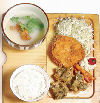
鶏メンチカツ と スパイスとりから ¥1150