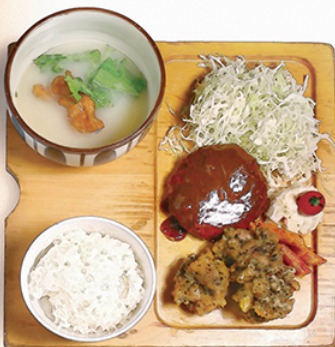
炭焼 鶏ハンバーグ と スパイスとりから ¥1150

ハンバーグは トリガラスソース もしくは 季節のソースをお選び下さい。 トリガラスソースとは 長時間煮込んだ鶏だしで作るオリジナルのデミグラスソースです。