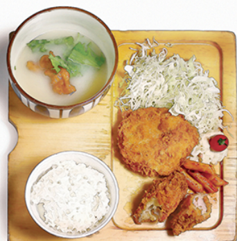
鶏メンチカツ と チキンカツ ¥1150