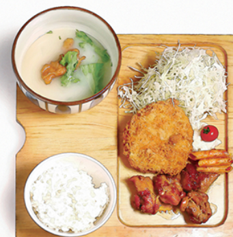
鶏メンチカツ と 炭焼鶏もも照焼き ¥1200