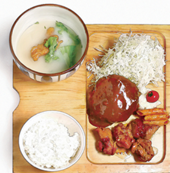
炭焼 鶏ハンバーグ と 炭焼鶏もも照焼き ¥1200