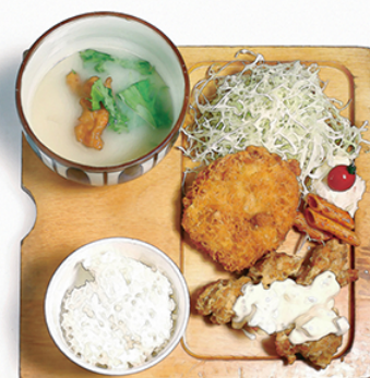
鶏メンチカツ と チキン南蛮 ¥1200