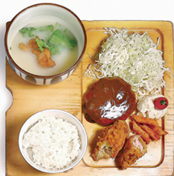
炭焼 鶏ハンバーグ と チキンカツ ¥1150