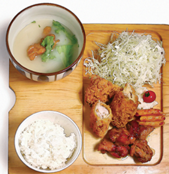
チキンカツ と 炭焼鶏もも照焼き ¥1150